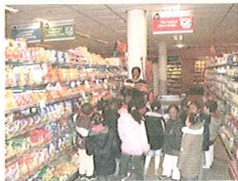
Doorgaande lijn taal- en woordenschatonderwijs